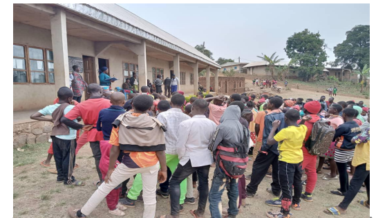
Einschreibung für das neue Schuljahr