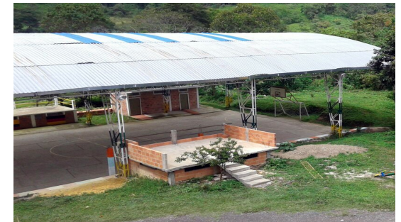
Polideportivo Die Sportanlage

Aktivitäten in Oberursel: Reinerlös von Schulfesten, Spendenläufe, Benefizkonzerte und Einzelspenden Mitarbeit erwünscht bei: Aktionen