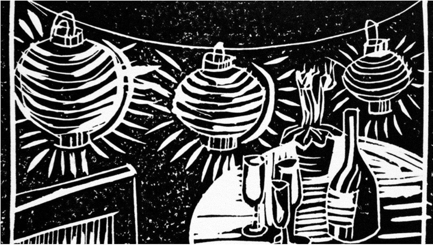
Beispiel eines Soft-Cut-Motivs