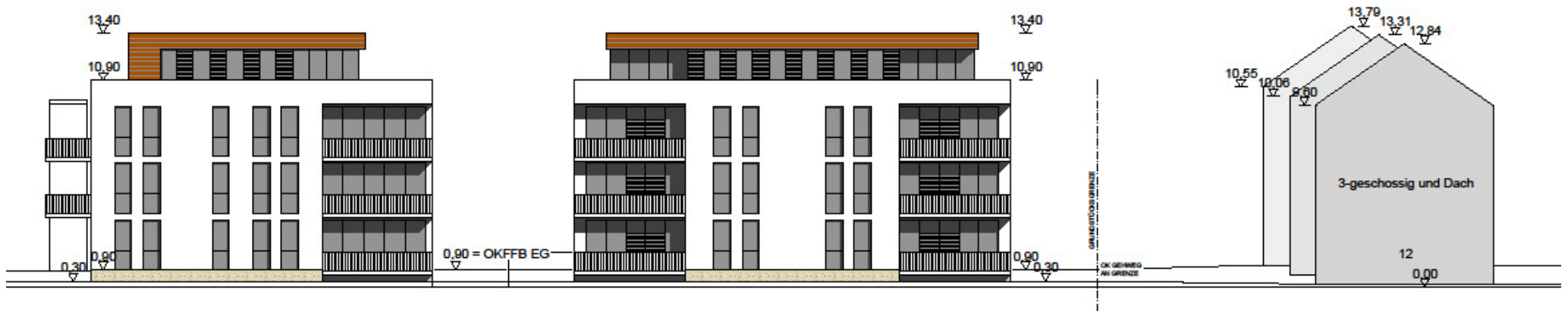
ANSICHT HAUS 1 UND 2 HEIDEGRABEN