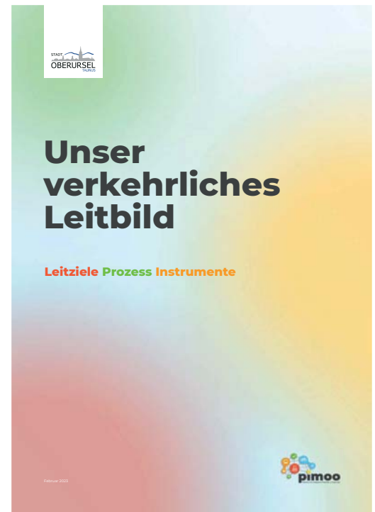
Bild 1: Die sieben Leitziele im Leitbild der Stadt Oberursel.